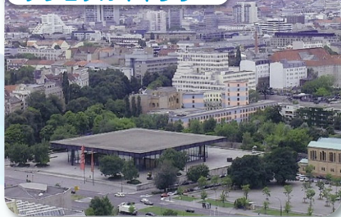
ナショナルギャラリー