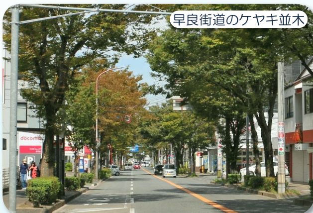
早良街道のケヤキ並木

数年前、志賀設計の所員の方たちが、朝皆さんで事務所前の街路樹の落葉を清掃をされているのを見かけたことがあります。良い光景だなあと思った記憶があります。私の会社の前の早良街道(早良区干隈)のケヤキも毎年秋になると落葉が歩道に積もり、うちの会社でも近所の商店の人たちと一緒に落葉掃除をしています。