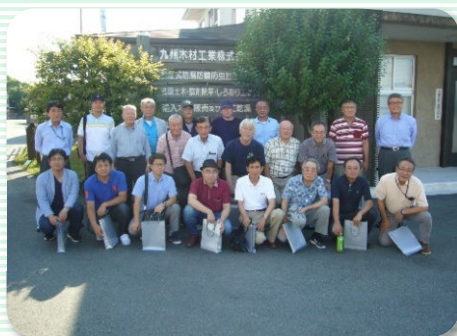
福岡県建築士事務所協会 筑豊支部