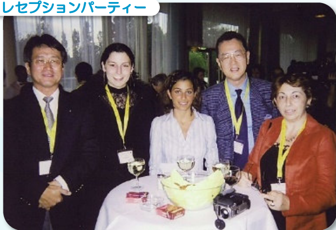
レセプションパーティー

ありましたが、天井から設備の音がうるさく夜眠れないので室を替えてもらいました。UIAの大会はクラシックなナチスドイツ時代からあったような建物に展示ブースがあり、大会式典はドイツ語、英語他五ヶ国語の同時通訳があったのに日本語がなかったのにはがっかりしました。当時世界で二番目にUIAにお金を納めていたのにJIA本部は何をしているのかと思いました。